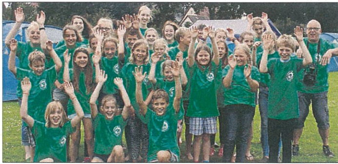
DIE Jugendgruppe des Geflügelzuchtvereins Morsum und Betreuer freuen sich auf eine schöne Woche.

VERDEN 11 bis 12 Uhr: Lauf- und Nordic-Walking- treffen beim SV Hönisch, Vereinsheim. 14 Uhr: Am letzten Sonntag im Monat: Wanderung für Singles ab 55 Jahre, Treffen auf dem BBS-Parkplatz, Neue Schul- straße. 15 bis 16.30 Uhr: Margarethe, Frau des Grobschmiedes, öffentliche Stadtführung, Treffpunkt am Lugenstein.